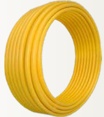
Doğalgaz Borusu Natural Gas Pipe