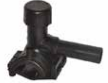
EF Abone Bağlantısı EF Tapping TEE