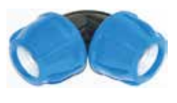
Kaplin Dirsek Coupling Elbow