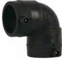
EF Dirsek // EF Elbow