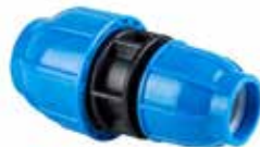
Kaplin Redüksiyon Coupling Reduction