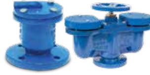
Vantuz Air Release Valves