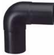
Alınkaynak Dirsek Butt Welding Elbow