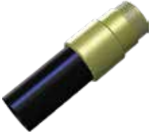
Düz Çelik Geçiş Steel Toggle