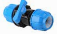
Kaplin Vana Coupling Valve