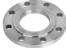
Düz Çelik Flanş Steel Flange