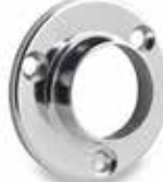
Boyun Flanş Neck Flange