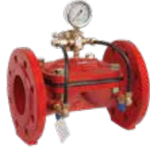
Basınç Düşürücü Vana Pressure Regulator Valve