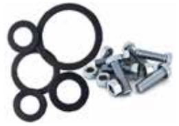
Conta & Civata Gasket & Bolt