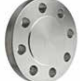
Kör Flanş Butt Welding End Flange