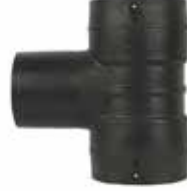
EF TE // EF TEE