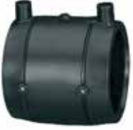
EF Manşon // EF Muff