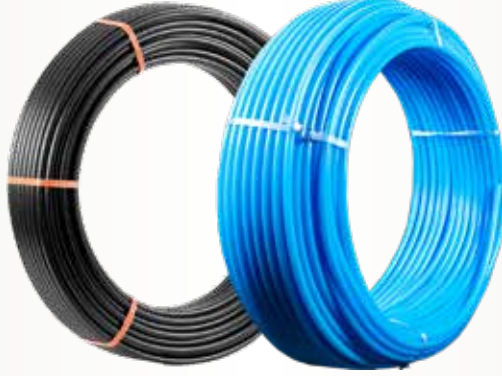
HDPE100 İçme Suyu Borusu HDPE100 Potable Water Pipe