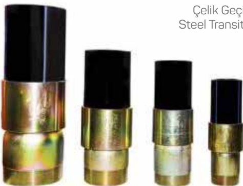
Çelik Geçiş Parçası Steel Transition Piece