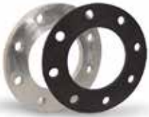
Adaptör Flanş Adapter Flange