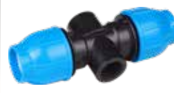
Kaplin Dağıtıcı Coupling Distributor