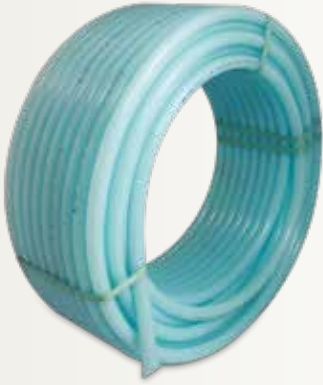
HDPE32 İçme Suyu Borusu HDPE32 Potable Water Pipe

أنابيب البولي إيثيلين لمياه الشرب والغاز الطبيعي