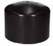
Alınkaynak Tapa Butt Welding End Cap