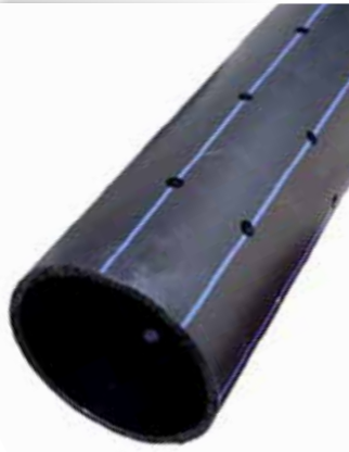
HDPE100 Drenaj Borusu HDPE100 Drain pipe