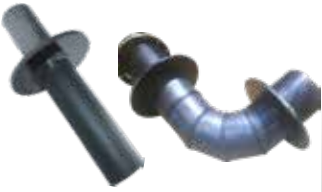
Beton Geçiş Parçası Concrete Transition Piece