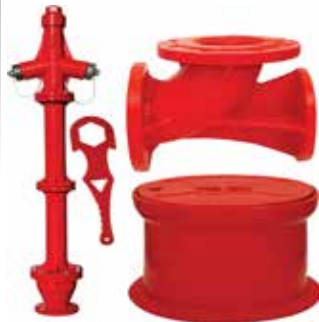
Yangın Hidrantı Fire Hydrant