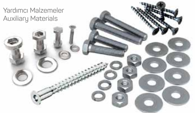
Yardımcı Malzemeler Auxiliary Materials