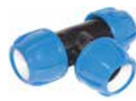
Kaplin TE Coupling TE