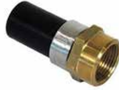
Paslanmaz Çelik Geçiş Stainless Steel Toggle