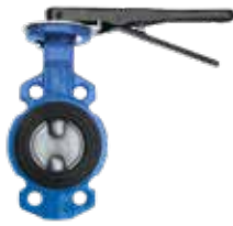
El Kumandalı Kelebek Vana Hand Operated Butterfly Valve