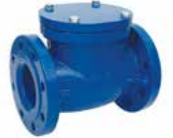
Çekvalf Check Valve