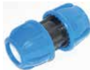
Kaplin Manşon Coupling Muff