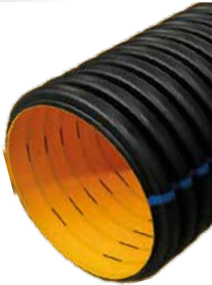
Koruge Drenaj Borusu Corrugated Drain pipe