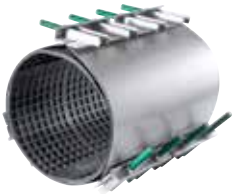
Kolay Tamir Kelepçesi Easy Repair Clamp