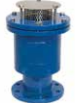
Darbesiz Kinetik Vantuz Non-slam (Kinetic) Air Release Valve