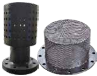
Poliyeten ve Paslanmaz Krepin Polyethylene & Stainless Strainer