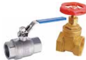
Küresel - Şiber Vana Ball - Gate Valve