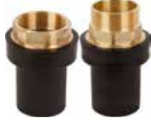
Pirinç Çelik Geçiş Bell Metal Steel Toggle