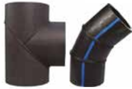
HDPE Ek Parça Özel İmalat HDPE Fittings Custom Manufacturing